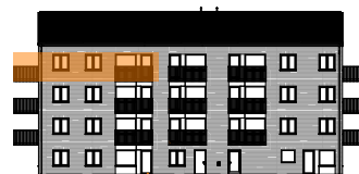
Hus D, mot gården