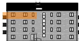
Hus D, mot gatan