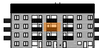
Hus D, mot gården