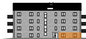
Hus C, mot gatan