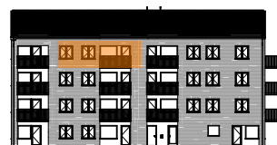
Hus B, mot gården