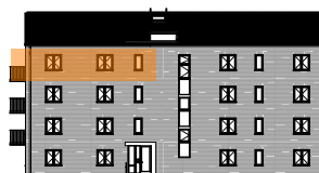
Hus B, mot gatan