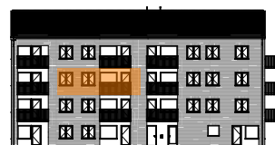
Hus B, mot gården