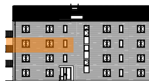
Hus B, mot gatan