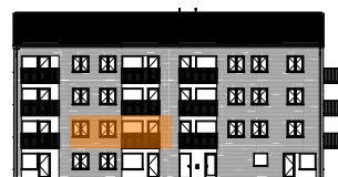
Hus B, mot gården