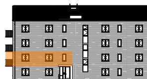
Hus B, mot gatan