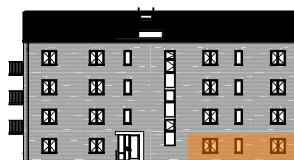
Hus B, mot gatan