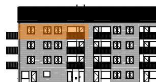
Hus A, mot gården