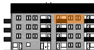
Hus A, mot gården