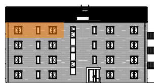
Hus A, mot gatan