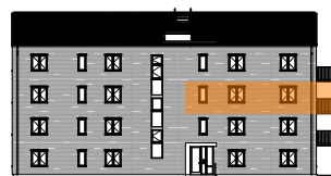
Hus A, mot gatan