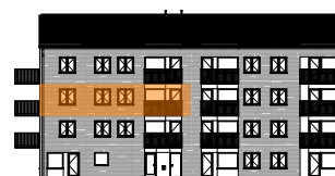
Hus A, mot gården