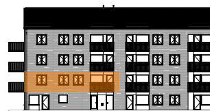
Hus A, mot gården