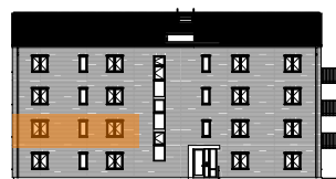
Hus A, mot gatan