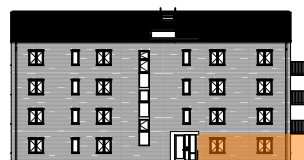
Hus A, mot gatan